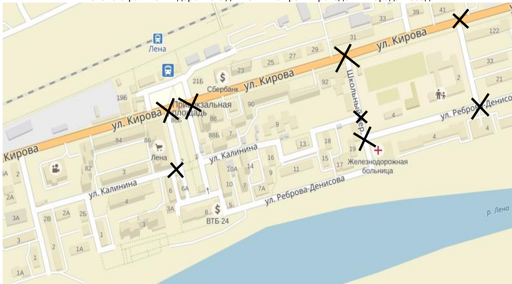
Схема ограничения дорожного движения во время проведения Парада Победы

Приложение № 5 к постановлению администрации муниципального образования «город Усть-Кут» от 26.04.2018г. № 387-п