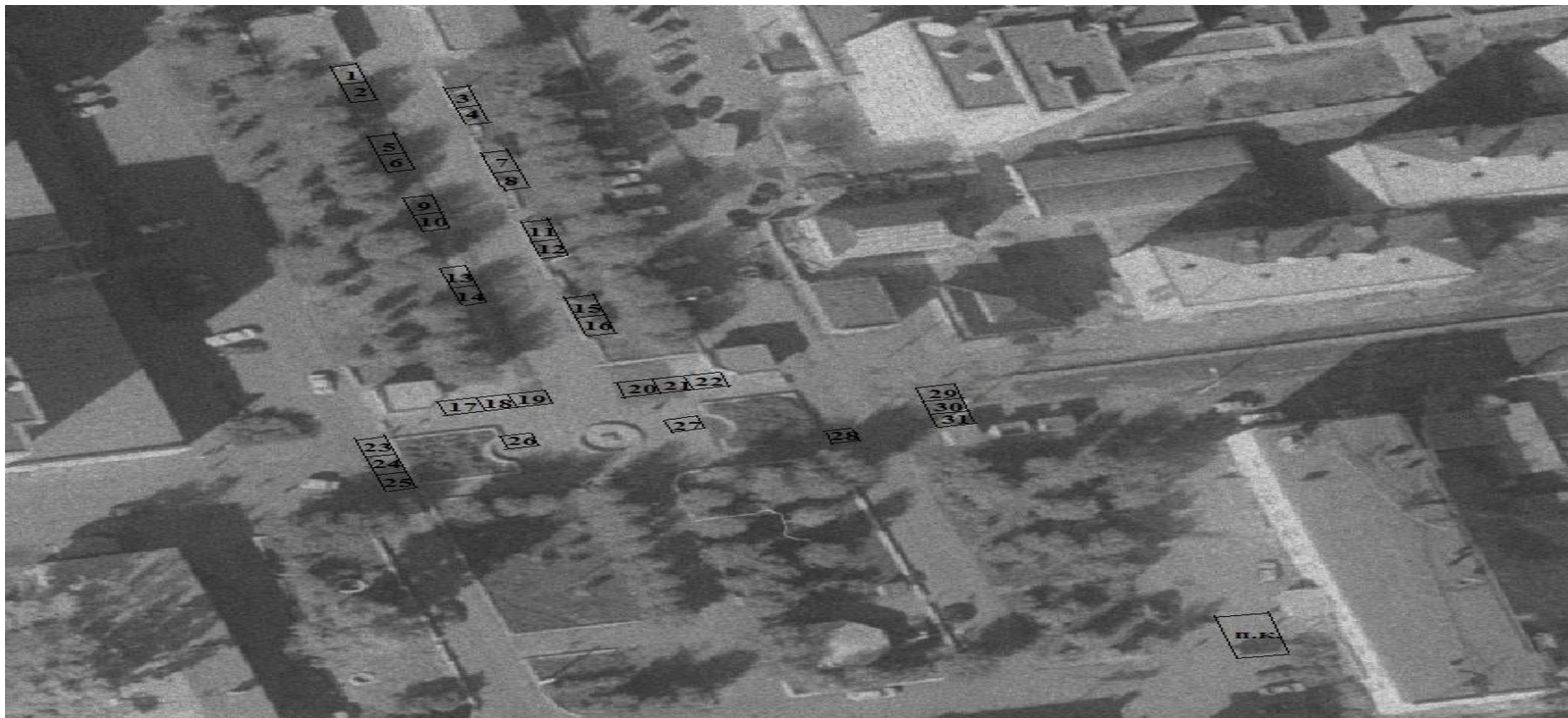
Схема размещения объектов торговли.

Приложение № 7 к постановлению администрации муниципального образования «город Усть-Кут» от 26.04.2018г. № 387-п