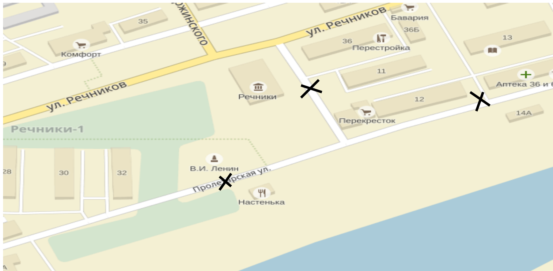
Схема ограничения дорожного движения во время проведения праздничного концерта на площади МБУК ДК «Речники»

Приложение № 6 к постановлению администрации муниципального образования «город Усть-Кут» от 26.04.2018г. № 387-п