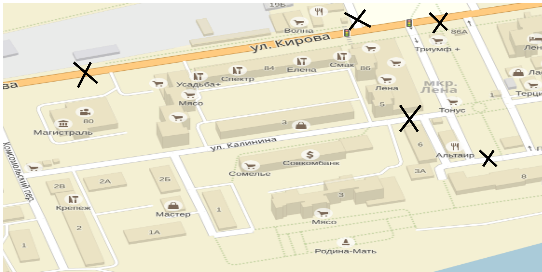
Схема ограничения дорожного движения во время проведения шествия «Свеча памяти»

Приложение № 3 к постановлению администрации муниципального образования «город Усть-Кут» от 26.04.2018г. № 387-п