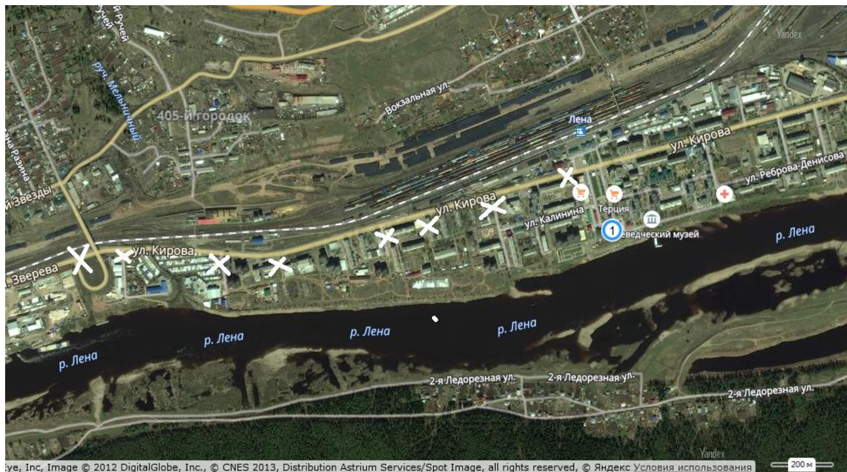
Схема ограничения дорожного движения во время проведения эстафеты

Приложение № 4 к постановлению администрации муниципального образования «город Усть-Кут» от 26.04.2018г. № 387-п