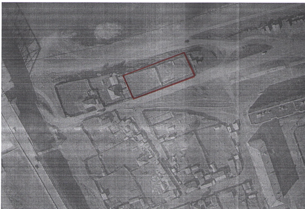
Схема резервируемого земельного участка