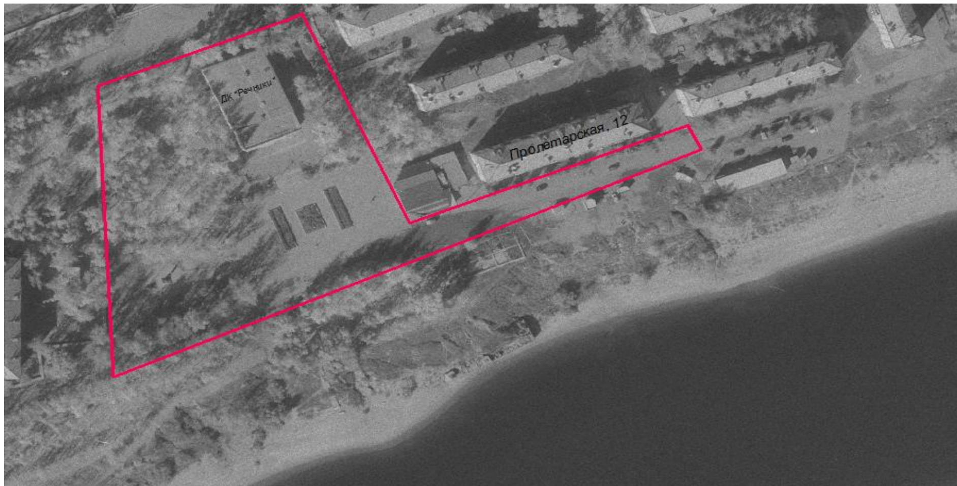
Схема границ территории проведения праздничных мероприятий

Условные обозначения: _____ границы территории проведения праздничных мероприятий