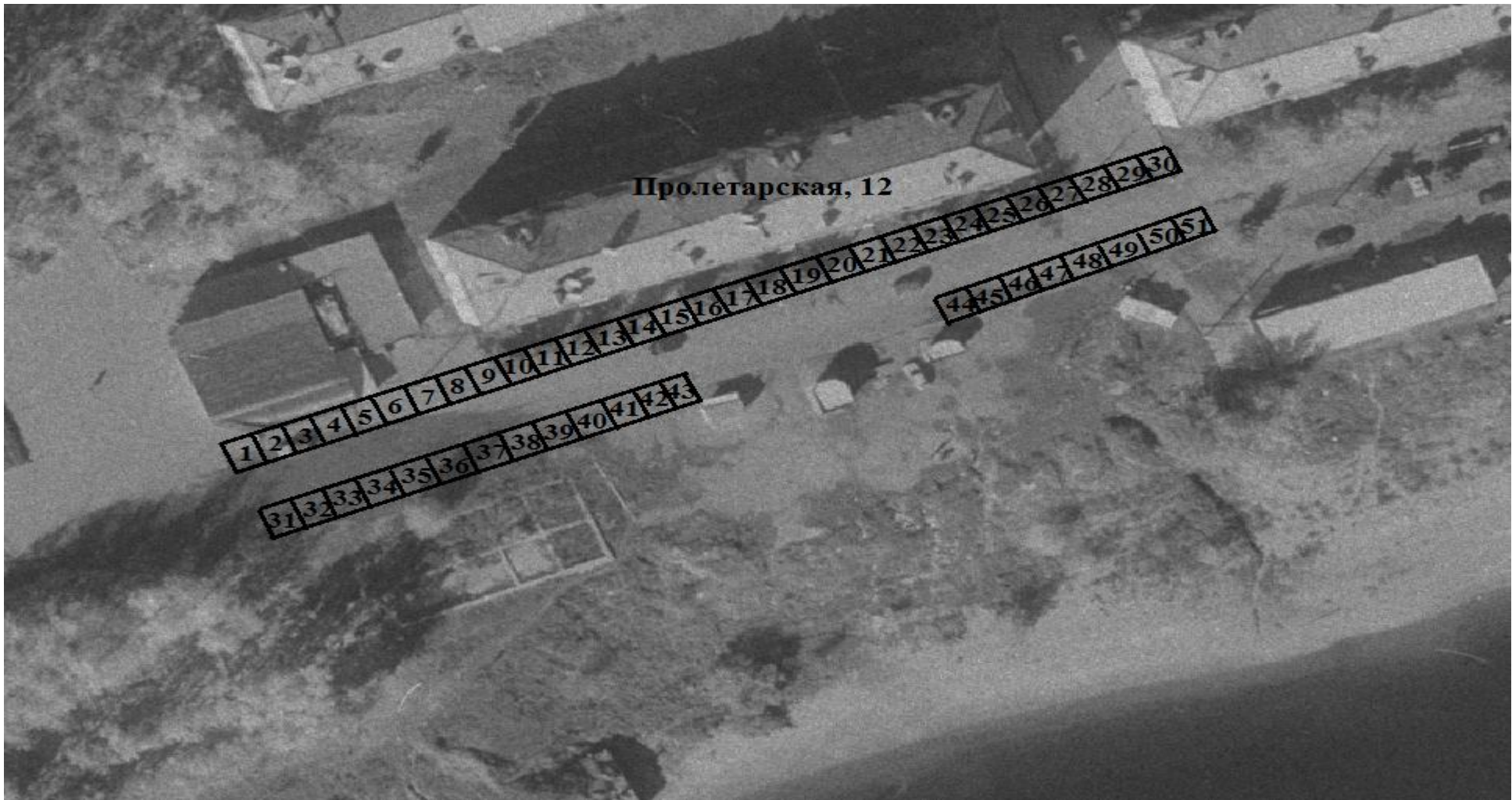
Схема размещения торговых мест

Приложение № 2 к постановлению администрации муниципального образования "город Усть-Кут" от 13.02.2017г. №147-п