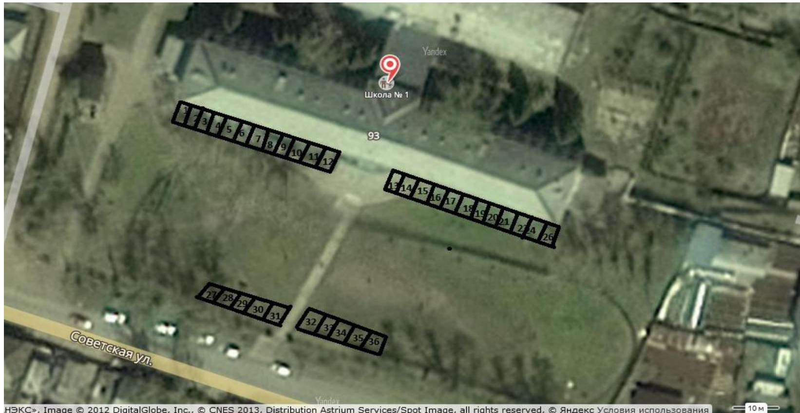
Схема расположения торговых объектов

НЭКС», Image © 2012 DigitalGlobe, Inc., © CNES 2013, Distribution Astrium Services/Spot Image, all rights reserved, © Яндекс Условия использования