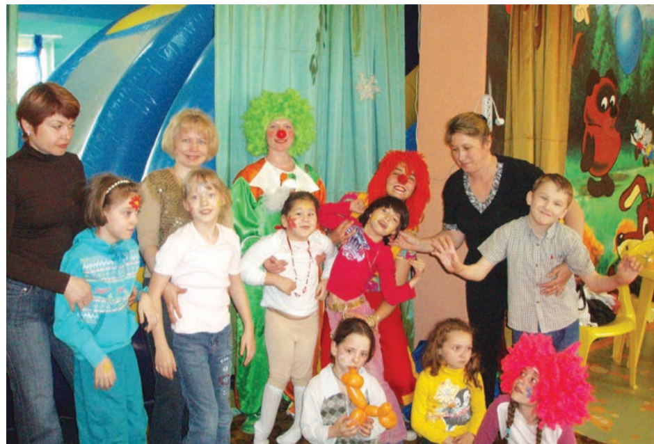
На детские праздники мы приходим целыми семьями

— Сложно сказать... Можно, конечно, вспомнить про цели и задачи, но это лишь сухие слова: социализация и интеграция инвалида в общество, реабили-