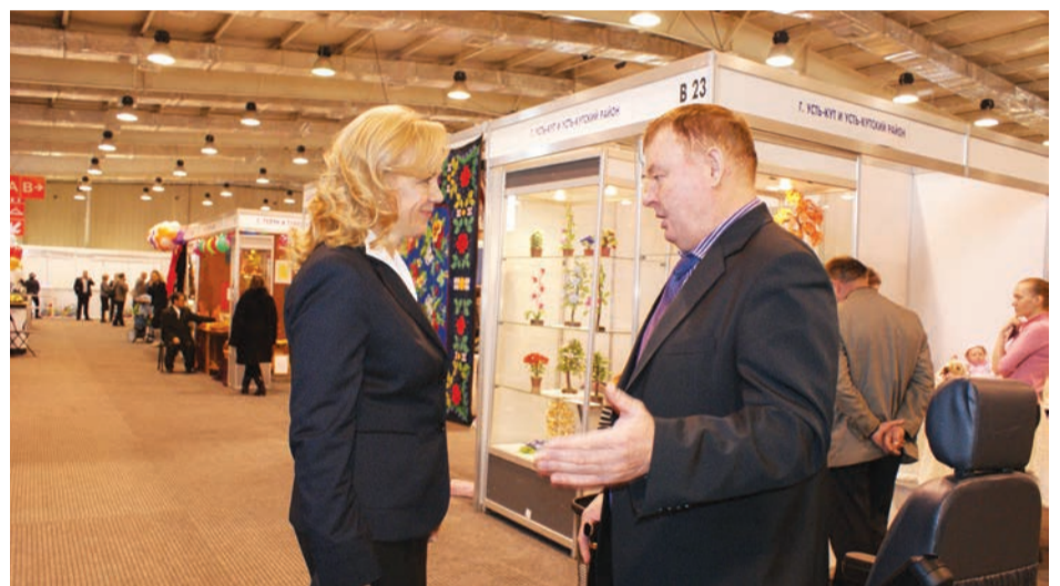
Сейчас люди уважительно стали относиться к тем, кто ограничен в здоровье

выставка поделок «Подари частичку своего творчества». На мини-выставках представляем различные поделки из бисера, бумаги... Знаете, какие есть среди наших девочек мастерицы?! Они увлекаются довольно редкими видами рукоделия, например, ирландским кружевом.