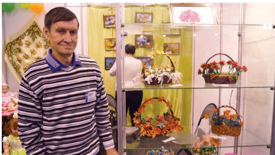
Участник выставки «И невозможное – возможно!»