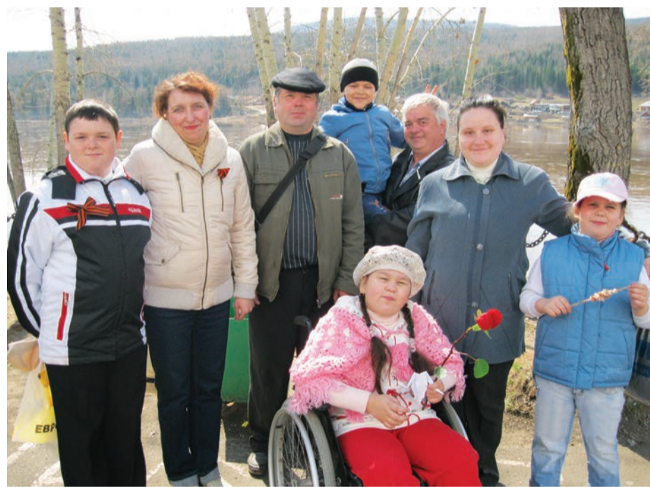
ВОИ: Верить! Объединяться! Искать!

— Интеграция детей в общество, толерантность... Это, пожалуй, можно объединить в одно выражение: общение со сверстниками. Общение, которого так не хватает детям-инвалидам, как решается эта проблема?