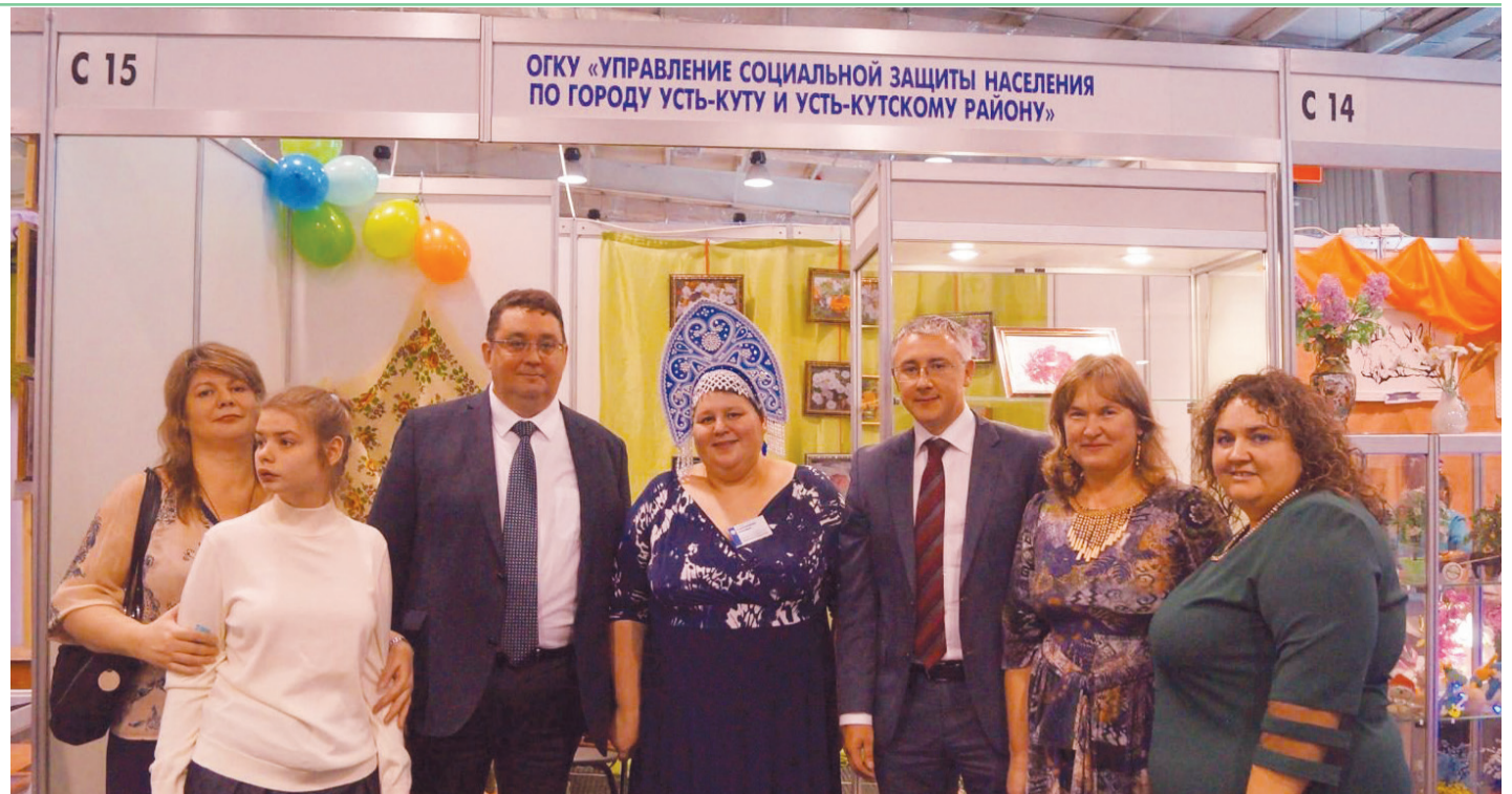
Больше всего встреч приходится на декаду инвалидов

— Действительно, мероприятий множество! Это и традиционные встречи, и чаепития, и календарные праздники. Больше всего, конечно, таких встреч приходится на декаду инвалидов, ведь нельзя всё провести в один день, а порадовать хочется всех. Мероприятия проводятся с учётом категории инвалидности и возраста. К примеру, совместно с домом-интернатом «Надежда» проводим шахматно-шашечный турнир, оформляется