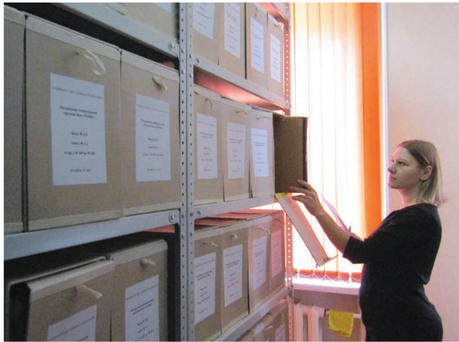
Архивы работают на перспективу, ведь они лишь хранят историю, а пишут ее люди

но не застрахованы от того, что фирма, в которой они трудились в лихие девяностые, не сдала в архив никаких сведений или вообще была «призраком». Но ещё прискорбнее осознавать то, что некоторые руководители не придают особого значения тому, что документы по личному составу должны храниться, как зеница ока. И в архив они должны поступать в полном объеме, ведь в наше время, как показывает практика, «без бумажки ты – букашка».