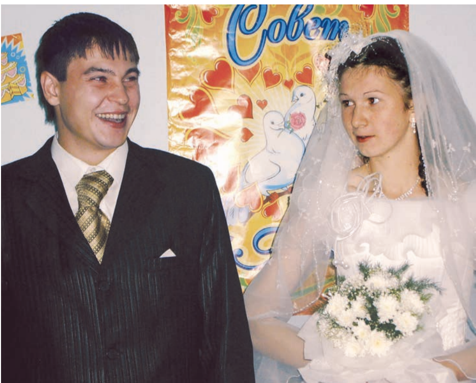
Самое большое счастье для каждого человека — это семья и дети

ТАТЬЯНА ЛАРИОНОВА