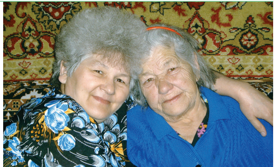
С любимой мамой