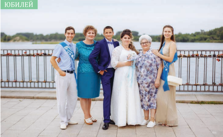
На свадьбе сына