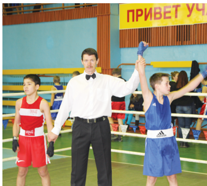
Победу завоевал сильнейший!