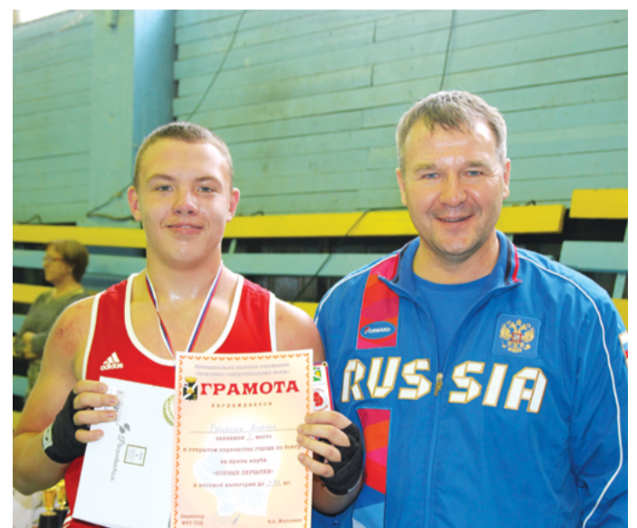
Большинство усть-кутских спортсменов получили заслуженные награды