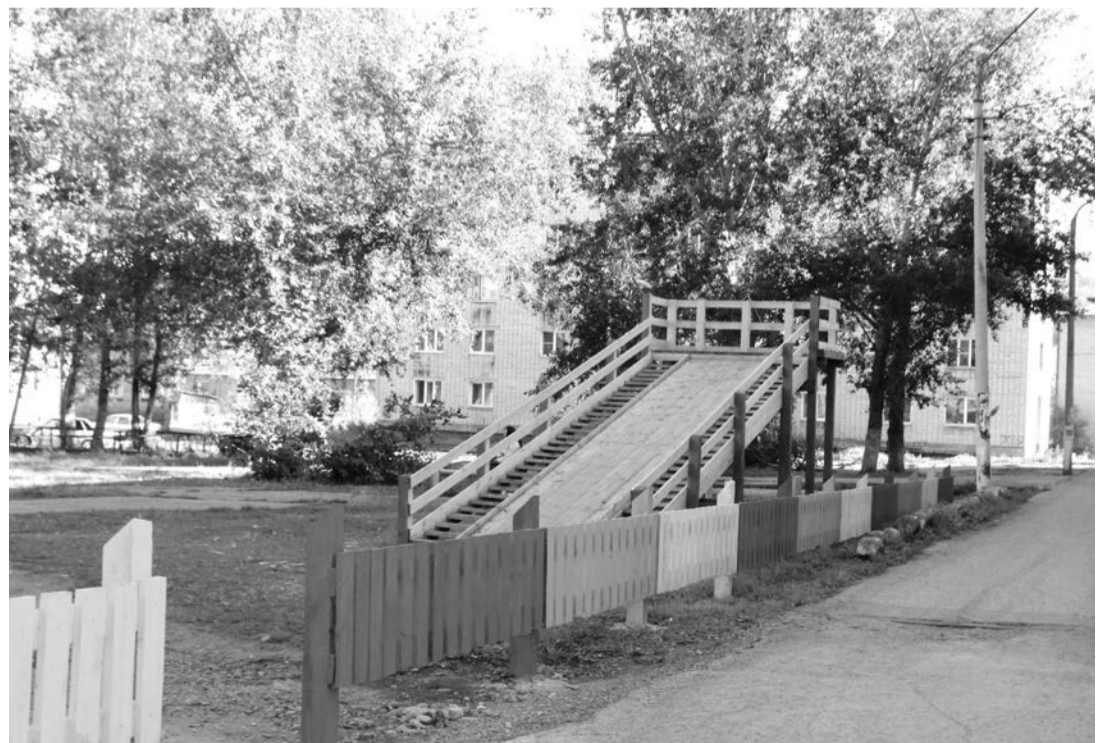
Ответственность за сохранность и обслуживание, согласно ГОСТу, ляжет на управляющие компании. Эти организации обязаны будут внести данный объект в технический паспорт дома