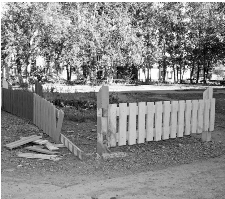
Ограждение вокруг горки по ул. Речников, 48 уже повреждено, предположительно автомобилем. Хочется, чтобы взрослые очень внимательно относились ко всему, что окружает их детей, в том числе и к игровым конструкциям