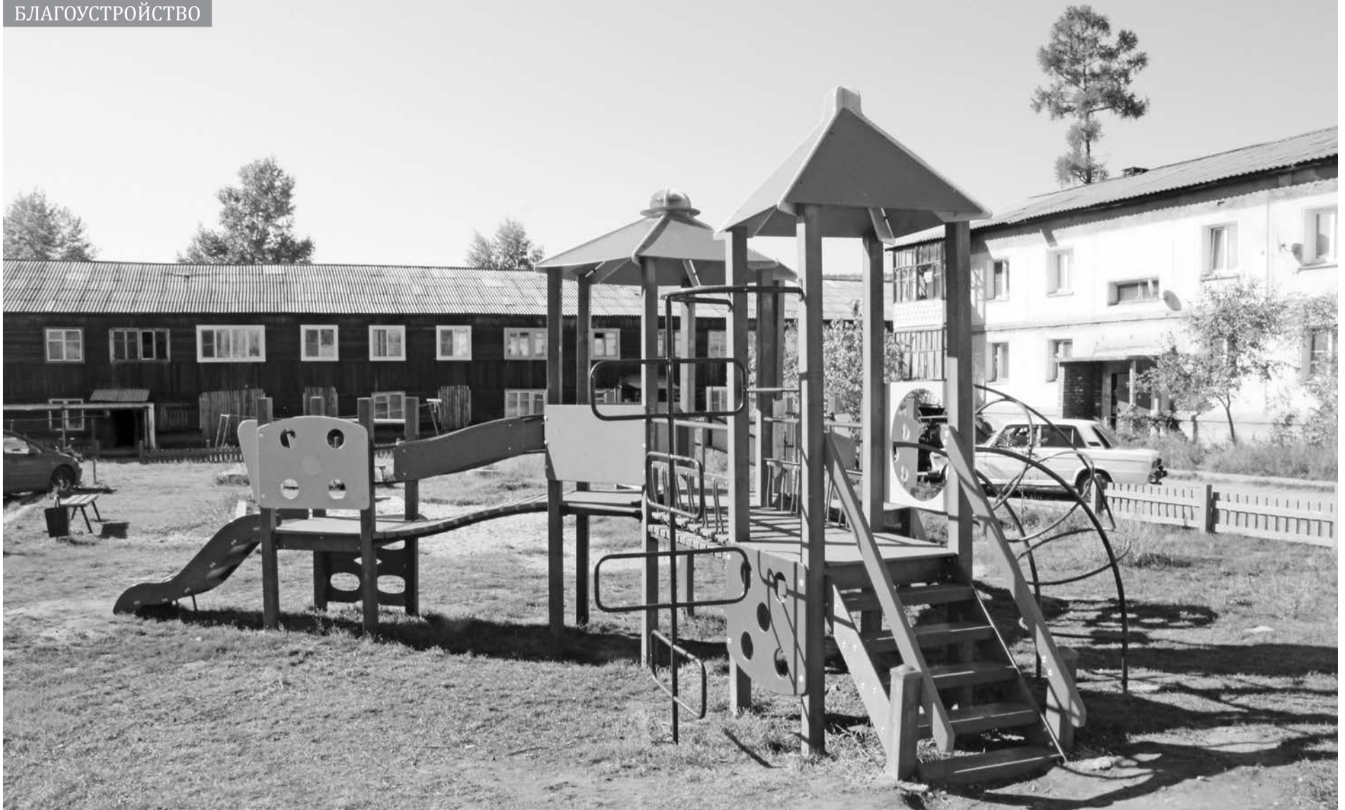
В этом году городской администрацией во дворах Усть-Кута были установлены три горки и детская площадка.